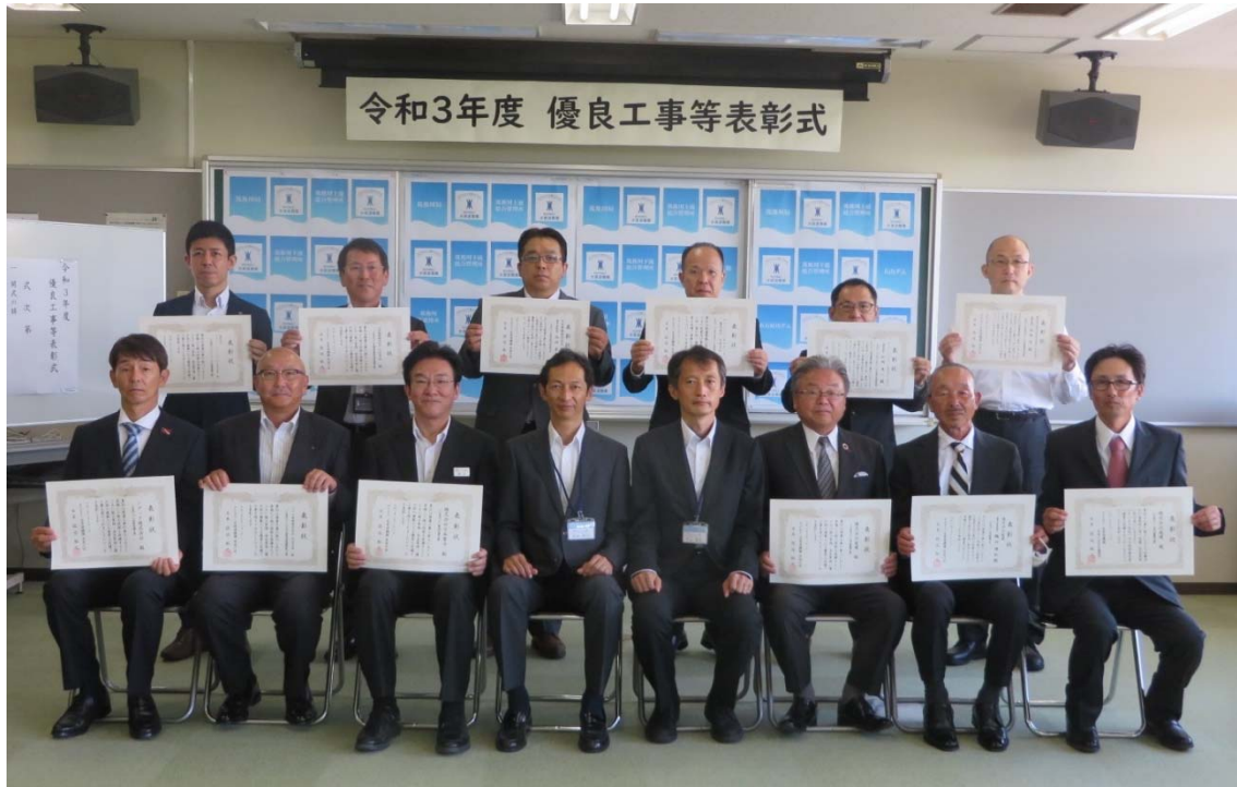
筑後川局長表彰受賞者