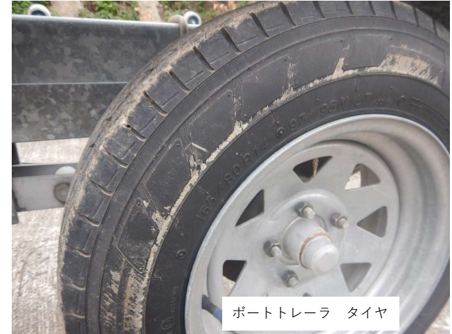
ボートトレーラ タイヤ