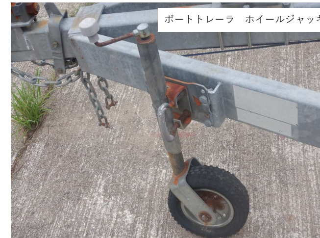
ボートトレーラ ホイールジャッキ