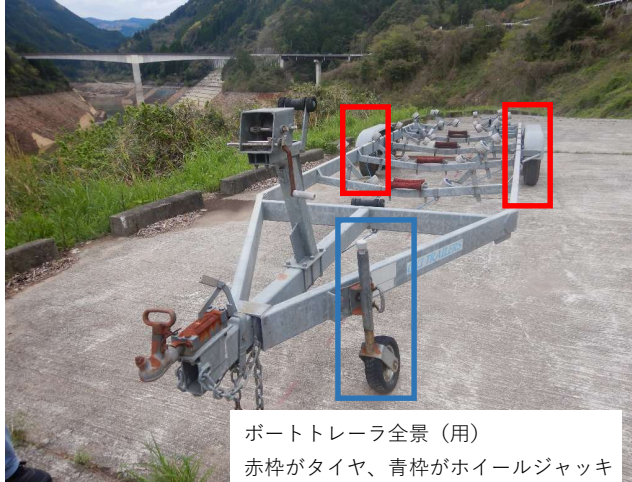
ボートトレーラ全景（用） 赤枠がタイヤ、青枠がホイールジャッキ