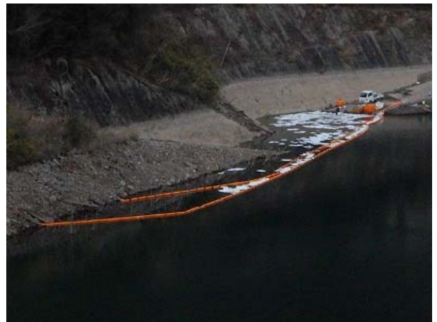
オイルフェンス等対策完了の状況(撮影2月3日 18時頃)