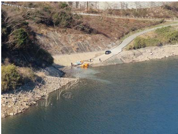
水質事故発生時点の状況(撮影2月3日 15時頃)