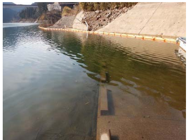
油分回収後の湖岸状況(撮影2月5日11時頃)