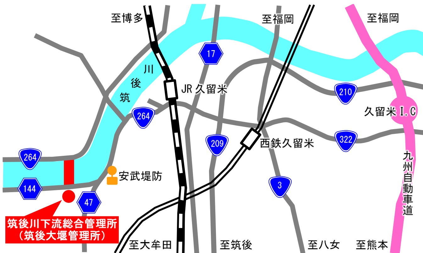
【筑後大堰管理所案内図】