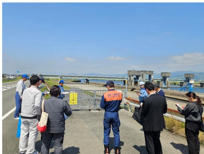
左岸側侵入防止施設の確認状況