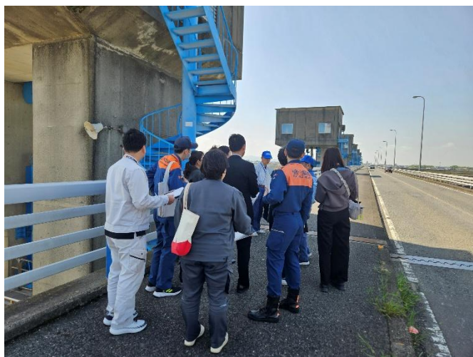
管理橋の確認状況