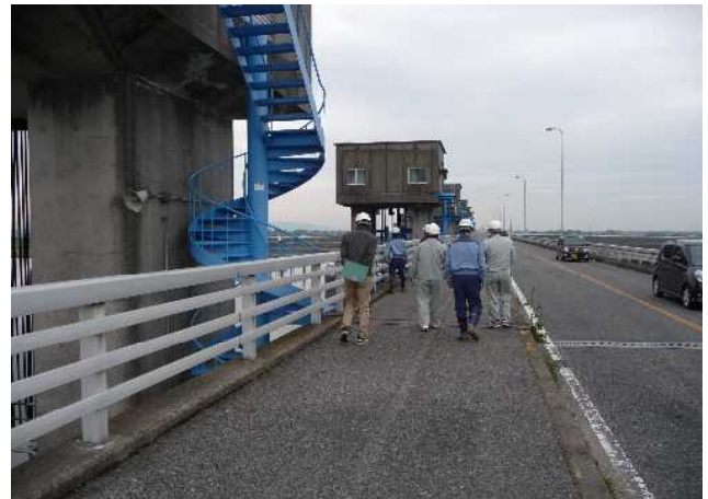
管理橋の確認状況