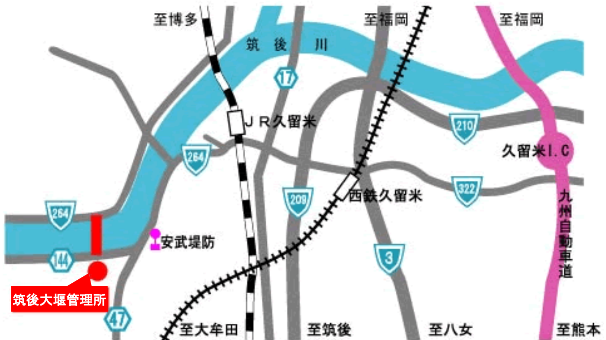
【筑後大堰管理所案内図】