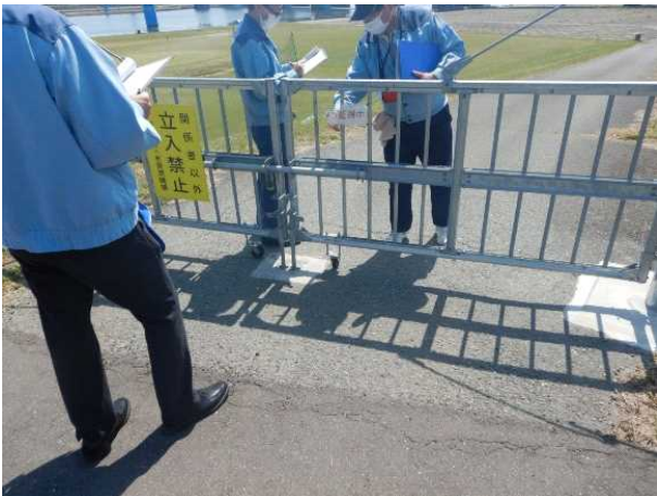
右岸側侵入防止施設の確認状況