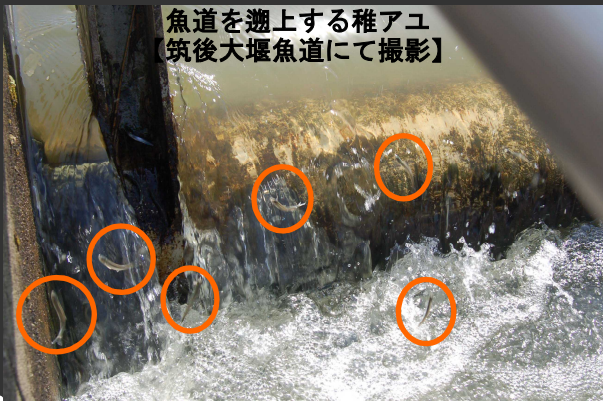
魚道を遡上する稚アユ 【筑後大堰魚道にて撮影】