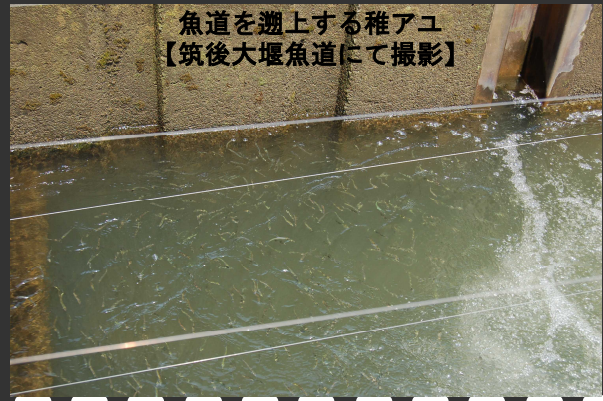
魚道を遡上する稚アユ 【筑後大堰魚道にて撮影】