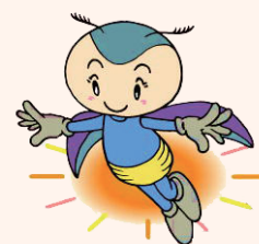
小石原川ダム イメージキャラクター あかりちゃん

イベント保険(傷害保険)に加入しますので、別途申込書に住所、氏名及び連絡先などを記入のうえ提出していただきます。電話で事前予約いただく際にご案内します。