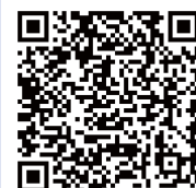
小石原川ダム 朝倉総合事業所 QRコード

ホームページ http://www.water.go.jp/chikugo/koishi/index.html