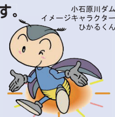
小石原川ダム イメージキャラクター ひかるくん

※ 荒天時(大雨、強風、積雪など)は見学を中止させていただきます。あらかじめご了承下さい。足場が不安定なところがありますので、運動靴など動きやすい格好でお越しください。