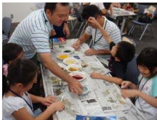
葉脈しおり作り(朝倉総合事業所)

その後、江川ダムでダム操作室などの施設見学を経て「東峰村」に到着しました。東峰村では、平成の名水100選に選ばれた「岩屋湧水」の紹介や「宝珠山きのこ生産組合」さんのご厚意でしいたけ栽培場の見学、小石原川の源流にある「行者杉」の見学、基幹産業である小石原焼の絵付体験など、楽しい村の情報が満載の探検となり、隊員全員が東峰村の一員になったような有意義な1日となりました。