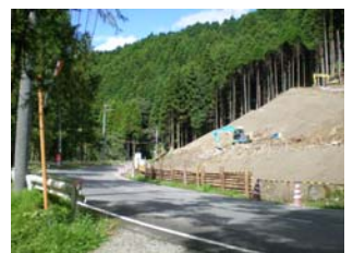
水浦2号進入路工事状況