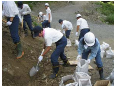
応急対策訓練(土のう・ブルーシート張り)