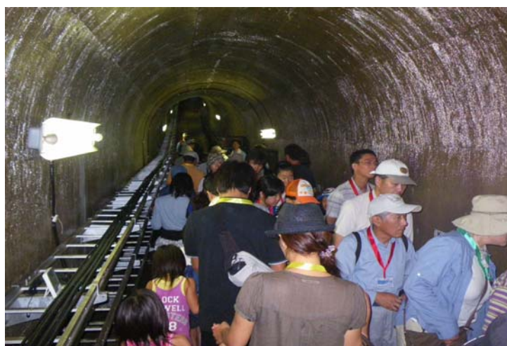
ダム堤体内のトンネル(監査廊)