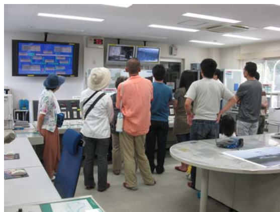
ダム管理の中核 操作室