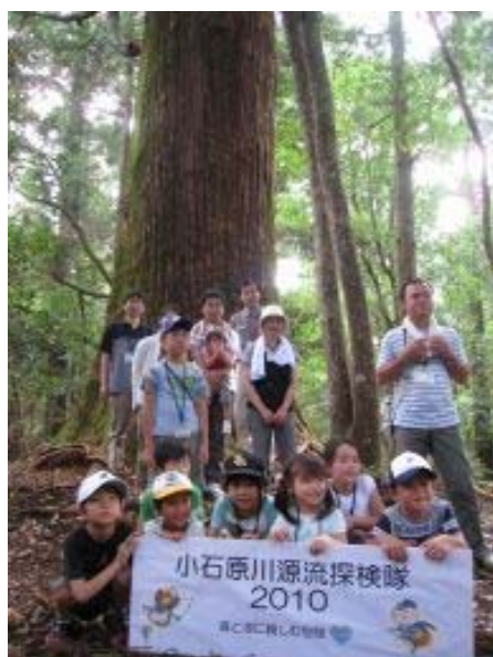
行者杉見学・小石原川源流(東峰村)

その後、江川ダムでダム操作室などの施設見学を経て「東峰村」に到着しました。東峰村では、平成の名水100選に選ばれた「岩屋湧水」の紹介や「宝珠山きのこ生産組合」さんのご厚意でしいたけ栽培場の見学、小石原川の源流にある「行者杉」の見学、基幹産業である小石原焼の絵付体験など、楽しい村の情報が満載の探検となり、隊員全員が東峰村の一員になったような有意義な1日となりました。