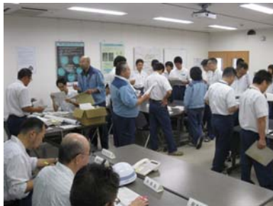
地震防災訓練の様子

また、9月2日には被災箇所の応急対策に必要な土のう作りと、土のうの積み上げ訓練を実施しました。水資源機構では、訓練を通じ職員一人一人の防災意識と応急対応能力の向上を図り、災害発生時には適切かつ迅速な行動が行えるように、努めていきます。