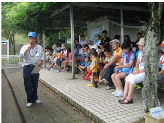
ダムの目的や概要の説明

この見学会では、寺内ダムの事業目的や洪水対応の状況を始め、普段お見せできないダム管理の中核である操作室やダム堤体内のトンネル(監査廊)を見学コースに組み込み、見学者の皆様へダム管理の状況を説明しました。