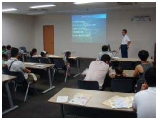
小石原川ダムの事業説明(朝倉総合事業所)

開催当日は真夏の透き通るような青空のもと、好奇心旺盛な隊員23名が集まり、まず朝倉総合事業所にて小石原川ダムの目的や環境保全についての説明を受けた後、「葉脈しおり作り」にみんなでチャレンジしました。