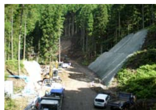
水浦1号進入路(その2)工事状況