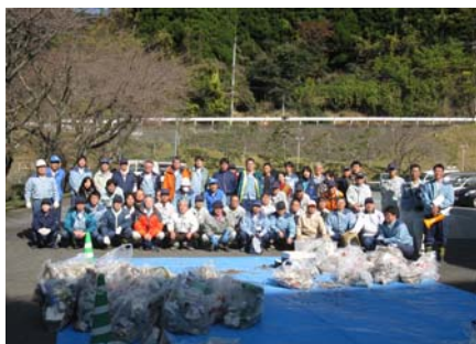
(小石原川の清掃に参加されたみなさん)

この清掃活動により、ダム貯水池周辺から大量の投棄物が回収されました。水資源機構では、不法投棄の防止に向け周辺パトロールを強化していきます。