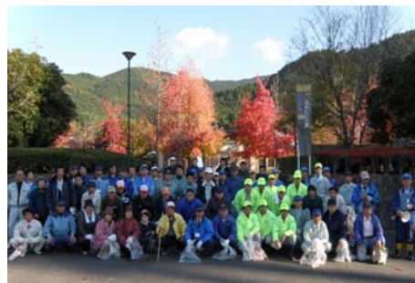
(佐田川の清掃に参加されたみなさん)