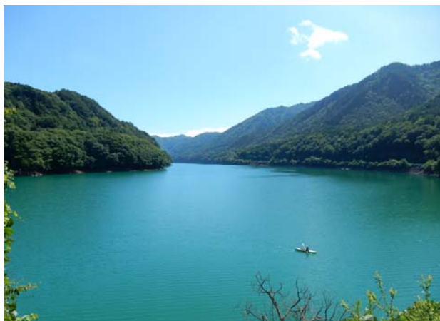
ダム諸量データ（平成28年8月16日0時状況）