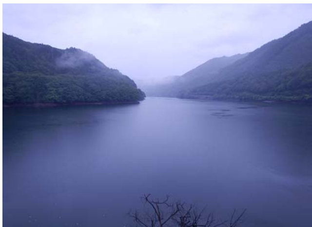
ダム諸量データ（平成29年 9月7日 0時状況）