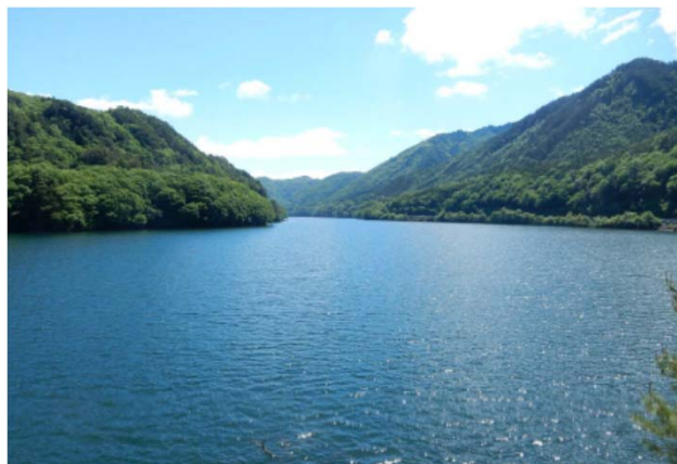
ダム諸量データ（平成30年6月1日0時状況）