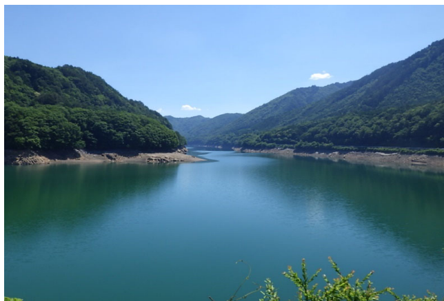
ダム諸量データ(令和4年7月1日 0時状況)