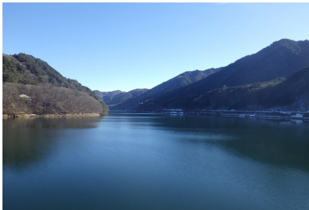
ダム諸量データ(令和8年1月9日 0時状況)