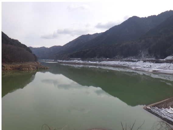
ダム諸量データ(令和8年2月6日 0時状況)