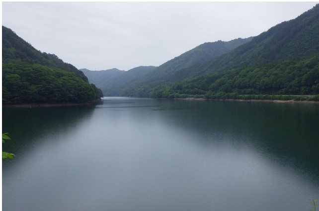
ダム諸量データ(令和8年6月2日 0時状況)