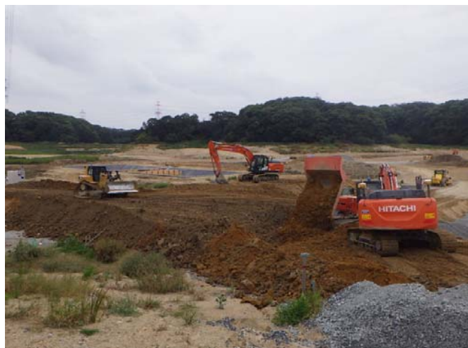
盛土材敷ならし状況