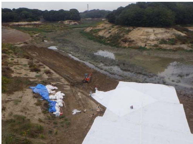
土木シート敷設状況