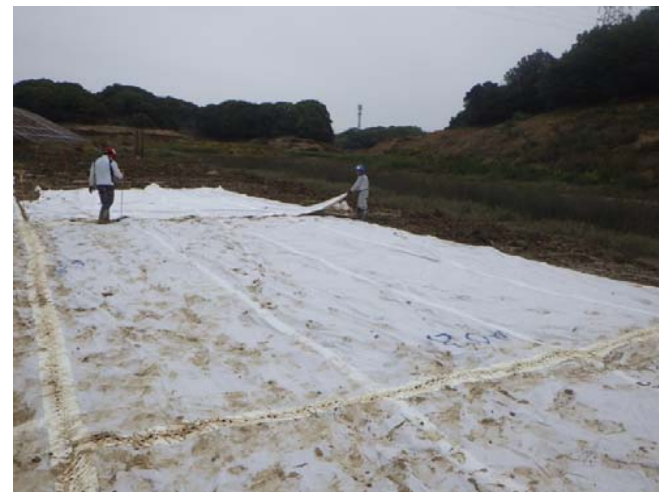
土木シート敷設状況