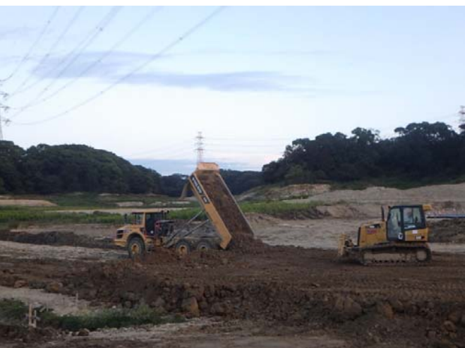
盛土材敷ならし状況