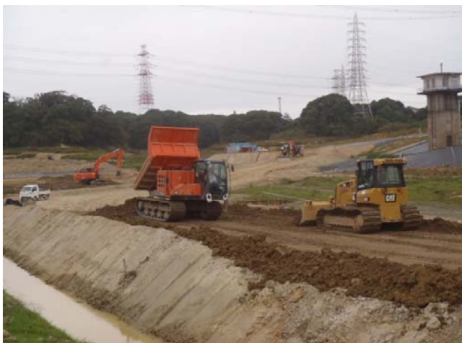
盛土材敷ならし状況