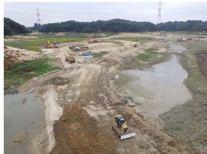
工事用道路造成状況