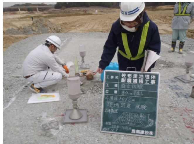
現場密度試験状況