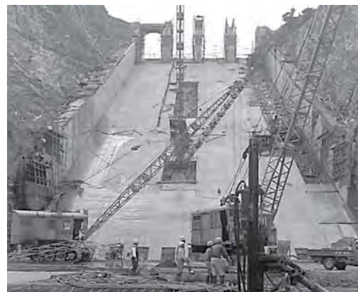
余水吐 よすいぼ にコンクリートを打つ工事 ※余水吐…大雨の時に水を安全に流すところ