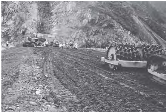
ダム本体の工事(機械で土を固めている作業)