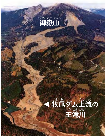
1984年(昭和59)御嶽山 崩落による土砂流入の様子

土や砂が溜まると、ダムに貯えることのできる水の量が減ってしまい水不足の原因となるため、土や砂を取り除く工事を1995年(平成7年)から行い、2007年(平成19年)3月に完了しました。