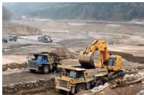
大量の土や砂の除去作業