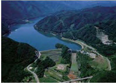
牧尾ダム 長野県木曾郡王滝村・木曾町