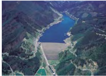
味噌川ダム 長野県木曾郡木祖村