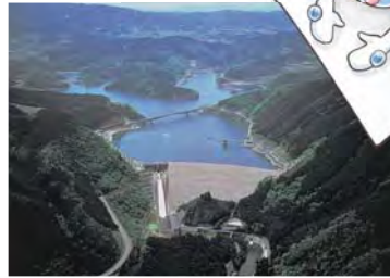
阿木川ダム 岐阜県恵那市・中津川市