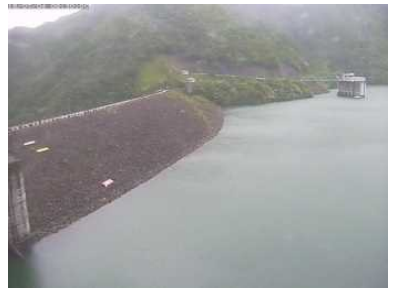
洪水貯留開始前の貯水池の状況 (7月4日9時頃)