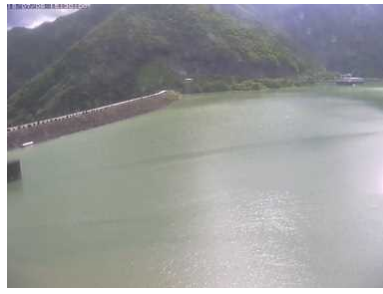
洪水時最高水位に近く貯水池の状況 (7月8日 15時30分頃)