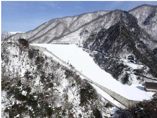
■雪化粧の徳山ダム堤体 平成30年

というわけで、今年の暖冬を皆様に感じていただくため、下に昨年と今年（1月18日に撮影）の写真を並べてみました。いかに昨年から寒かったか、おわかりいただけるかと思います。