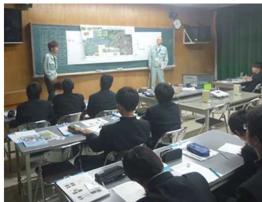
■豊川用水総合事業部初の出前授業

新城支所では初の出前授業ということもあり、先生方と入念に打合せを重ね、当日は、豊川用水の成り立ちから施設の役割、水の使われ方、二期事業についてを講義し、また豊川総合用水土地改良区からは、西部幹線水路から平井東支線のルート等についての説明をしました。