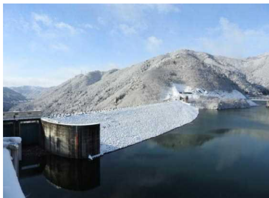
■ W 受賞をした岩屋ダム冬景色

今後も関係機関や住民の皆様と共に水災害への備えと水防災意識の向上に努めてまいります。