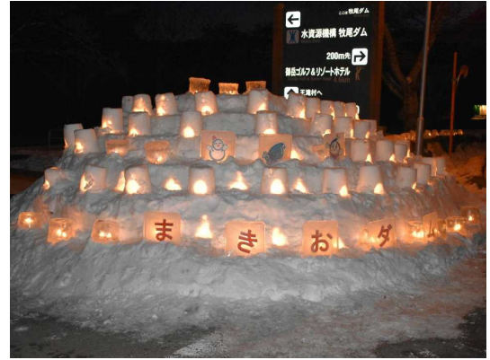
■ 昨年の牧尾ダムキャンドルの様子