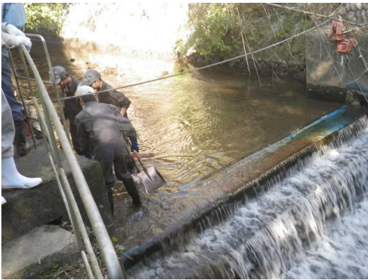
■ 寒さをものともせずゴミを集める新高校生

清掃を行った平井東支線は、西部幹線から分岐して管水路になり、そこから半場川（はんばがわ）へ落水し、下流の転倒堰で取水し、また開水路になるという、豊川用水では珍しい施設構成の支線となっています。出前授業で得た知識もあり、生徒たちは、清掃の意義を感じてくれたようでした。