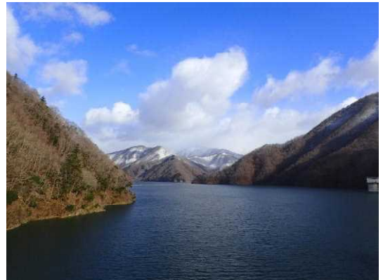
■今年1月18日の徳山湖