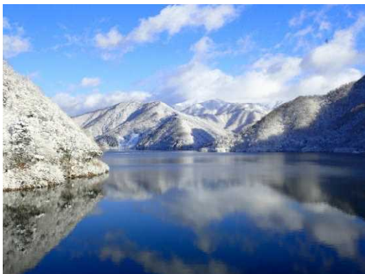
■凍てつく徳山湖 平成30年