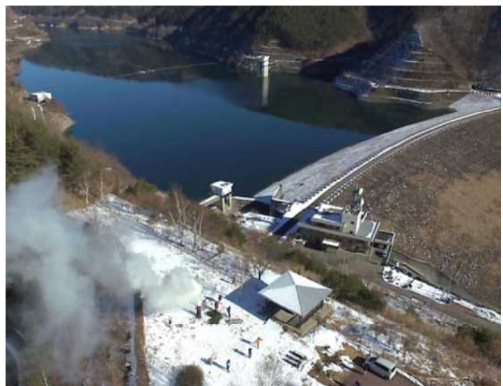
■ 空から見た木曾谷