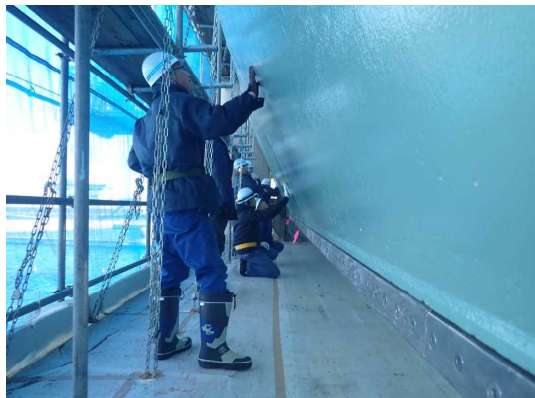
■木曽川大堰ゲート設備工事を見学

平成31年1月22日（火）木曽川用水の関係利水者を対象として、木曽川大堰ゲート設備整備工事の現地見学会を実施しました。当日は寒風の吹く天候にもかかわらず、岐阜県、愛知県、名古屋市、桑名市からの参加があり、ゲート設備の現状と今後の更新整備の方法や木曽川大堰の耐震照査の結果に関する質問が寄せられ、活発に意見交換することが出来ました。