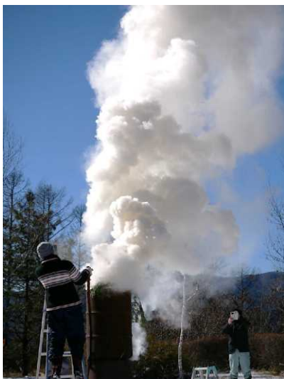
■ 柳沢尾根公園で狼煙あげ

晴れた空にもくもく立ち上がる煙を見ながら、今年1年の木曾谷の発展とそこに住む人々の幸せや健康を願わずにはいられませんでした。