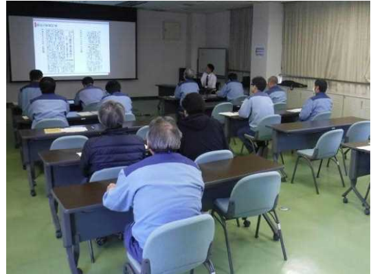
■ 三重県の取組みがわかった環境学習会

この学習会での学びを受け、三重用水管理所でも出来ることからコツコツと環境活動に取り組んでいく必要性を再認識しました。