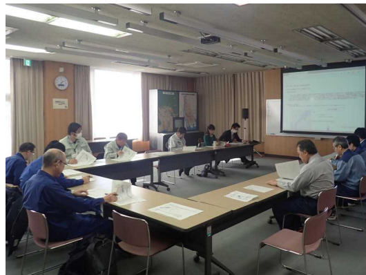
■参加者からは耐震などの質問も