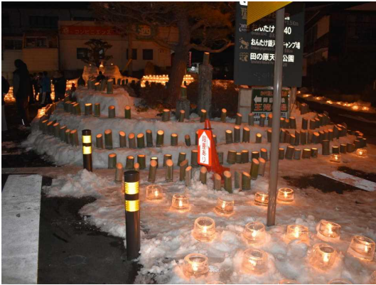
■ 昨年の王滝村会場の様子

近くにはおんたけ2240スキー場もあり、今はまさにスキーシーズン真っ盛り。この機会に冬の楽しさ満載の木曽路へお出かけになってはいかがでしょうか。