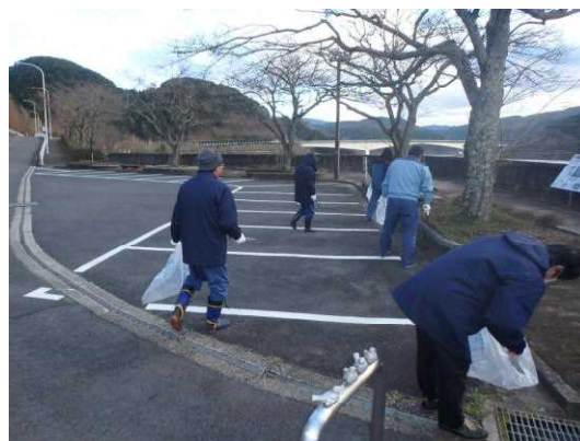
■新年を迎える前に職員総出でゴミ拾い

みんなで作る水源ダムとして、常日頃の清掃活動はもちろんのこと、ポイ捨ての注意喚起等、これからも貯水池周辺環境の改善のための活動を行っていきます。