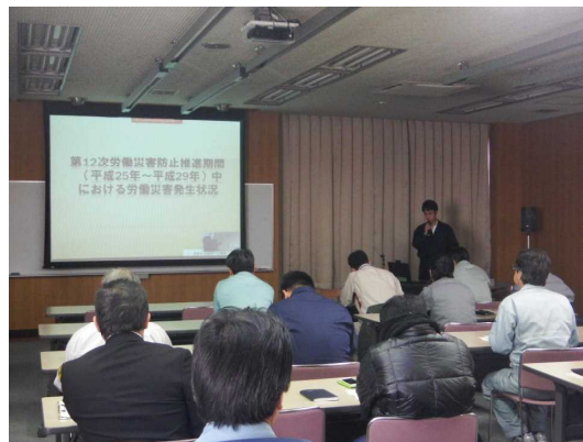
■労働基準監督署職員による講話

この研修で学んだことを生かし、受注者、機構とも無事故、無災害を目指して事業を実施していきます。