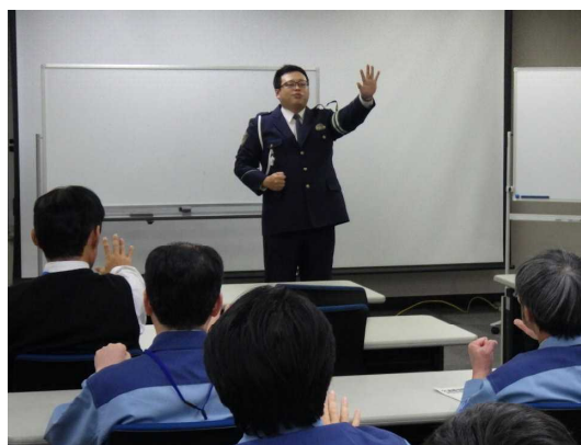
■愛知県警察署交通課主任による講話

参加した職員24名は、シートベルトの着用や薄暮時からのライトオン、スピードを控えるなど、当たり前前の交通ルールの重要性を再認識しながら、職場交通事故0目指すことを誓いました。