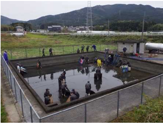
■ 2クラス約80名が清掃活動に参加

生徒たちは、身近にありながら知ることがなかった豊川用水の役割の大きさに驚いたようで、出前講座の手応えを感じました。