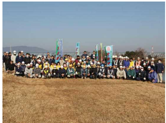
■ 清掃活動を終えて記念写真

これからも長良川河口堰を管理する職員として、こうした清掃活動に積極的に参加していきたいと思っております。