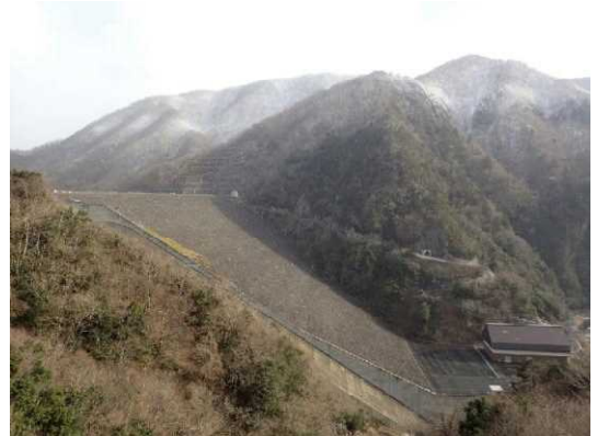
■今年1月18日の徳山ダム堤体