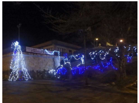
■阿木川ダム入り口のイルミネーション

阿木川ダムが今以上、地域から愛される施設となるようこれからも様々な取り組みを行っていきたいと思います。