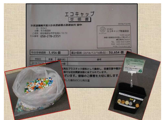
■ 専用のボックスを作って3956個を回収

わたしたちの身近な自然環境を守るために、ひいては地球環境を守るために、これからも継続して「エコキャップ運動」に参加していきます。