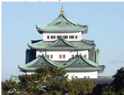
■名古屋城も木造天守閣で生まれ変わる

今年、皆様が新しい希望に向けて歩みだされますように。そして希望をかなえられますように。そう祈念しながら、今年最初の編集後記を結びます。