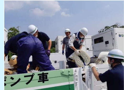
【ポンプ車の交換作業】