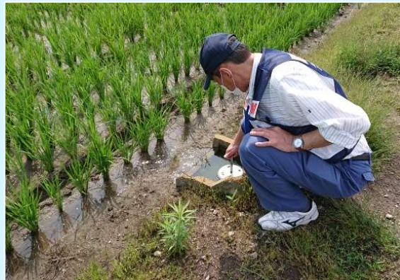
【受益地域での用水到達確認】