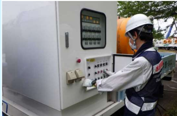
仮設ポンプの維持管理 (ポンプ運転、破損ポンプの交換作業等)