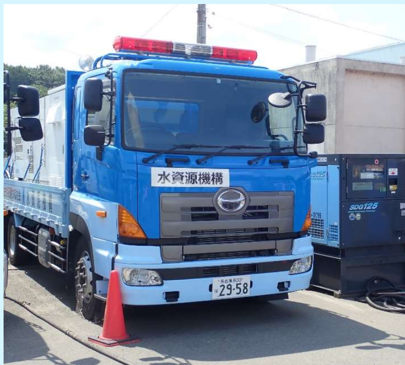
ポンプ車 (60m 3 /分) 2台及び パッケージポンプ (10 m 3 /分) 6セット設置

明治用水頭首工(愛知県豊田市)において発生した大規模な漏水事故について、令和4年5月17日に東海農政局から支援要請を受け、直ちにポンプ車等の機材及びポンプを設置・操作する人員32名を現地に派遣し、矢作川から緊急取水を開始しました。