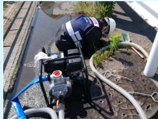
【空気弁の漏水対応】