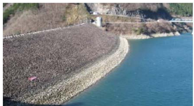
平成22年2月27日 9:00撮影 E.L.402.01m