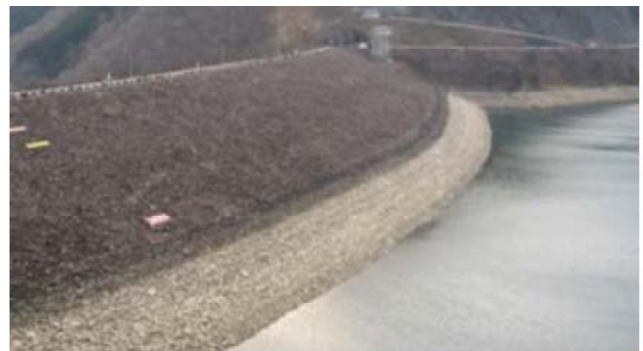
平成22年2月22日 15:00撮影 E.L.400.36m