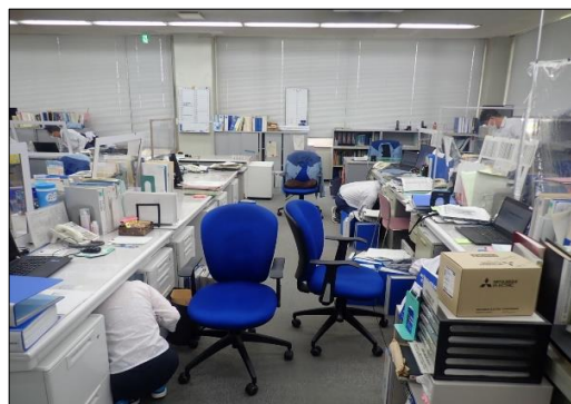
シェイクアウト訓練