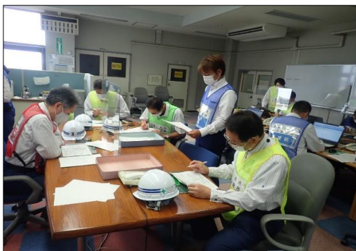
防災本部設置訓練

木曾川用水では引き続き防災訓練を実施し、緊急時に速やかに対応できるよう取り組みをすすめます。