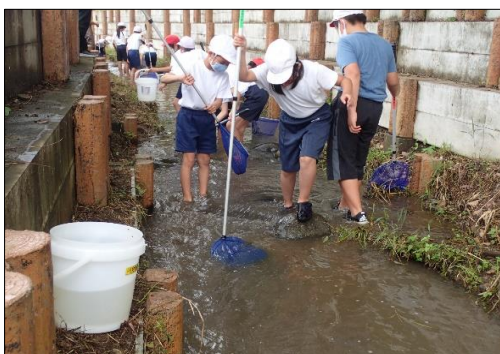
生き物の採取状況

コロナ禍の中ではありましたが、感染予防対策にも配慮し、児童たちは野外での活動に歓喜をあげ、楽しみながらの勉強会になりました。