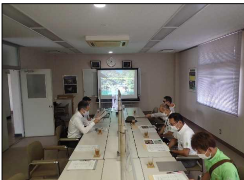
概要説明の様子 (美濃加茂管理所)

当日は、木曾川右岸連合土地改良区の協力を得て意見交換等も行い、両改良区のつながりも広がり、有意義な視察となりました。