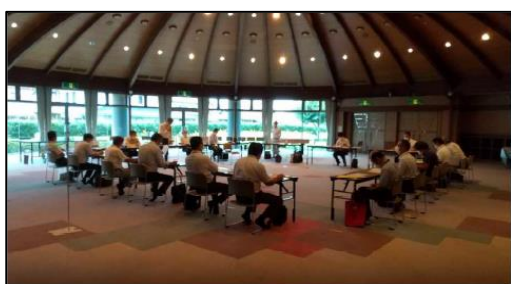
機構の開催挨拶の様子

当機構中部支社より、「①事業の精算額について」「②精算還付金の取り扱いについて」を説明し、費用負担者のご了承がいただけました。