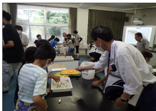
何がとれたかなあ