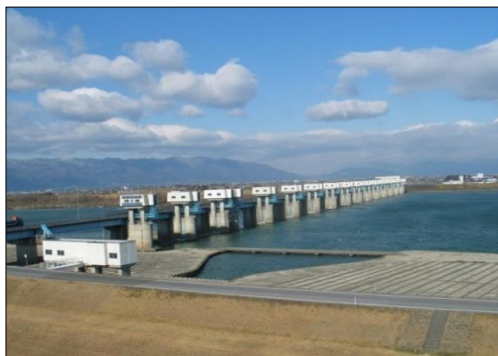
平常時 放流量約200m 3 /s