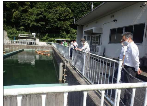
神淵沈砂池視察の様子