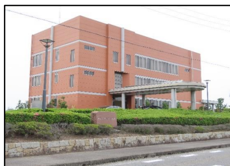
執務場所(海部土地改良区会館2階)