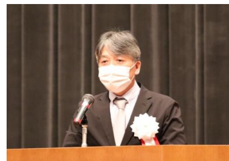
水資源機構 日置副理事長