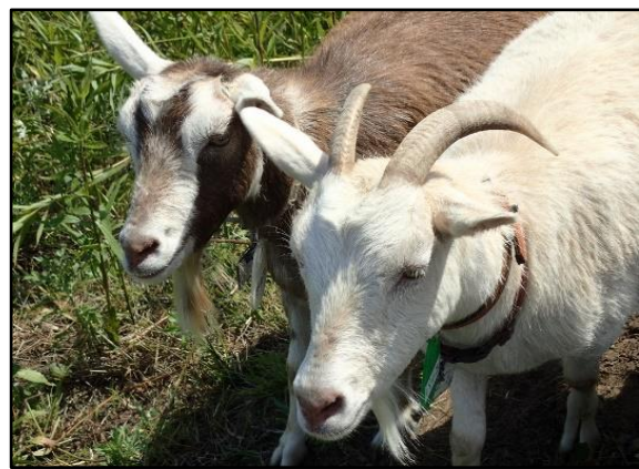
ヤギさん除草隊活躍中！