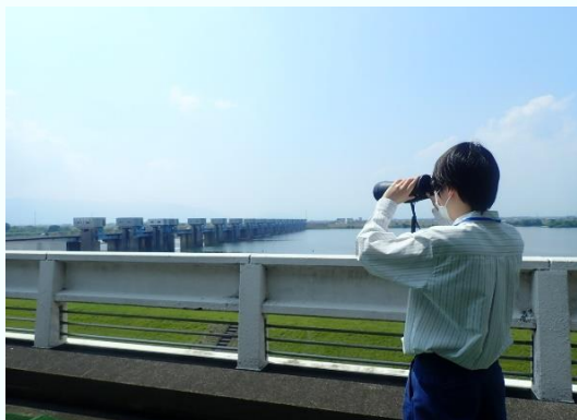
木曾川の様子を監視中

水資源機構に入社してから3ヶ月近くになりますが、わからないことがまだ数多くあります。先輩職員の方々にご指導をいただきながら、少しでも早く貢献できるようになりたいと思っておりますのでよろしくお願いいたします。