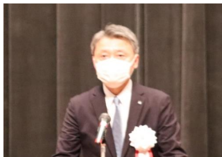
愛知県 古本副知事