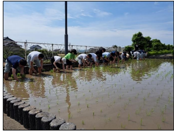
田植えをする様子