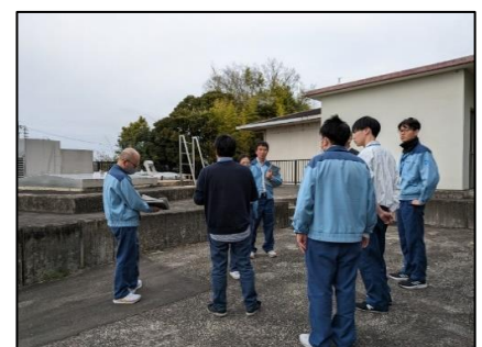
座学(総裁指針・点検施設の確認) 点検箇所の確認(弥富:立田除塵機) 点検箇所の確認(長良導水制水弁室)