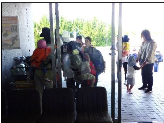
お散歩カートで来所

弥富管理所においても、いつ起こるかわからない災害に備え、日頃より様々な訓練を重ね災害発生時においても的確な対応を執れるよう努めて参ります。また、今後も地域で行われる行事等への協力など地域貢献にも努めていきます。