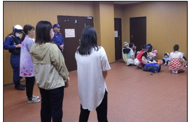
消防署員も見守っています