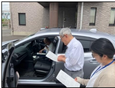
車載無線機使用訓練