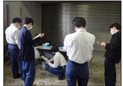
パケットテスト訓練

木曾川用水では、今後も様々な訓練等を実施し、全職員が的確 かつ速やかな初動対応が可能となるよう知識・技術の習得を目指 します。