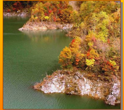
② 味噌川ダム (奥木曾大橋) 「ダム湖百選」