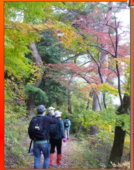
⑥ 鳥居峠「村指定文化財」