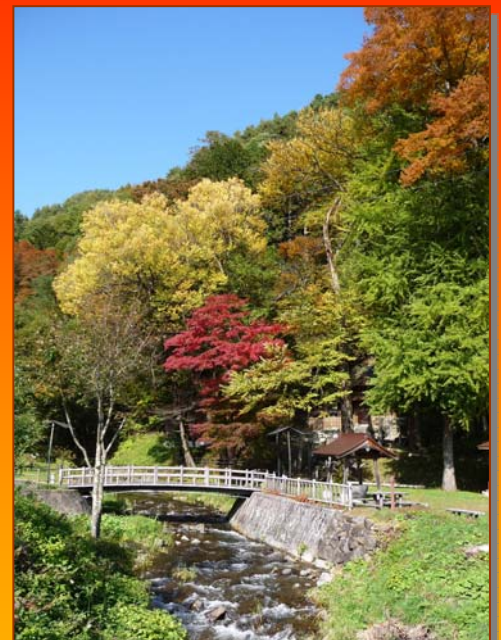
⑧ 衣更着神社「村指定文化財」