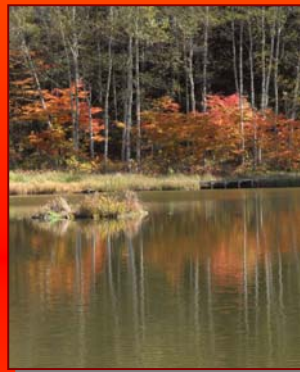
⑦ あやめ池公園 「ため池百選」