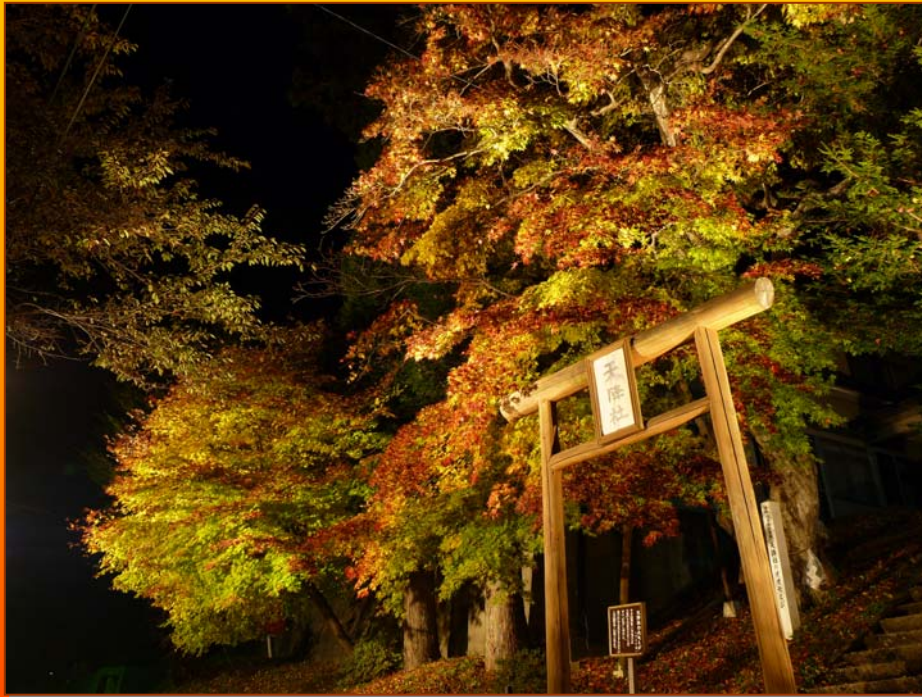
① 天降社「村指定文化財」(ライトアップ)