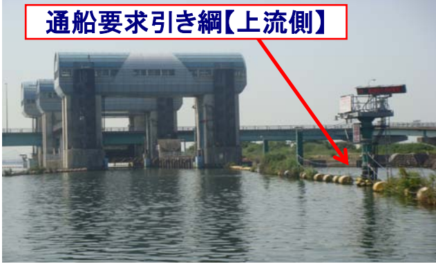
通船要求引き綱【上流側】