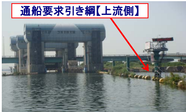
通船要求引き綱【上流側】