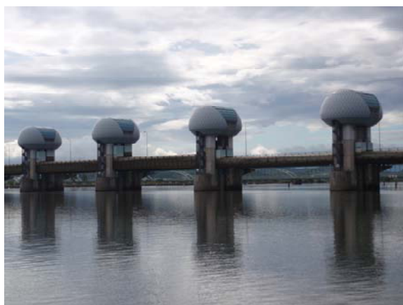
河口堰ゲート状況(下流側) 平成23年7月21日16時撮影

平成23年7月20日、台風の影響により、長良川の堰地点の流量が全開操作に移行する基準流量である毎秒800立方メートルに達したことから、洪水を安全に流下させるために、同日15時29分より洪水時（全開）の操作を行いました。その後、毎秒800立方メートルを下回ったことから、21日10時24分に全開操作を終了しました。