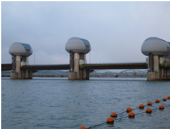
河口堰ゲート全開状況（下流側） 平成24年4月4日6時撮影

平成24年4月4日、低気圧の影響により、長良川の堰地点の流量が全開操作に移行する基準流量である毎秒800立方メートルに達したことから、洪水を安全に流下させるために、4日1時43分より洪水時（全開）の操作を行いました。その後、毎秒800立方メートルを下回ったことから、4日7時28分に全開操作を終了しました。