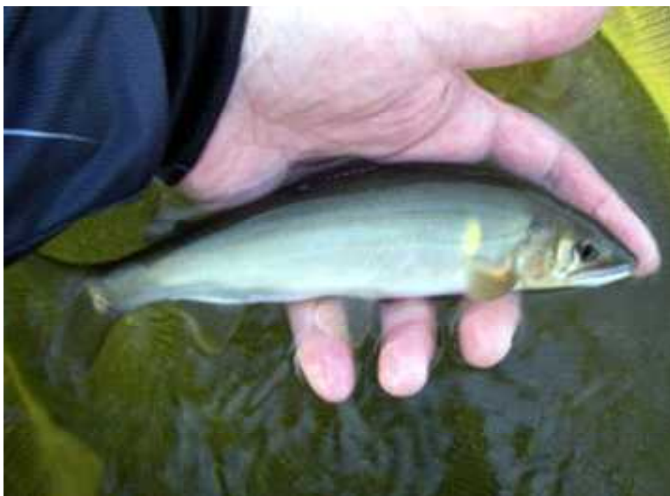
(長良川のアユ：成魚)