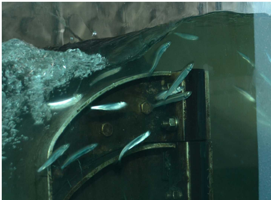
(平成25年4月8日 長良川河口堰呼び水式魚道を遡上するアユ)

アユは、通常、春に川を遡り、夏に上流でなわばりを作り成長して、秋に川で産卵し、ふ化したアユの仔魚は海へ降下し、親アユは産卵後に一生を終えます。そのため年魚とも、独特の香りがすることから香魚とも言われます。