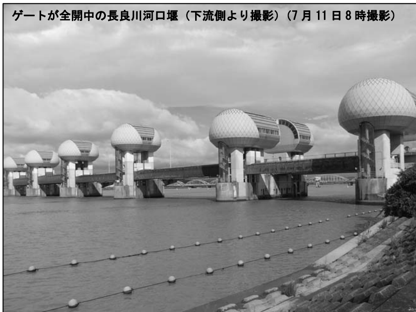
ゲートが全開中の長良川河口堰（下流側より撮影）（7月11日8時撮影）