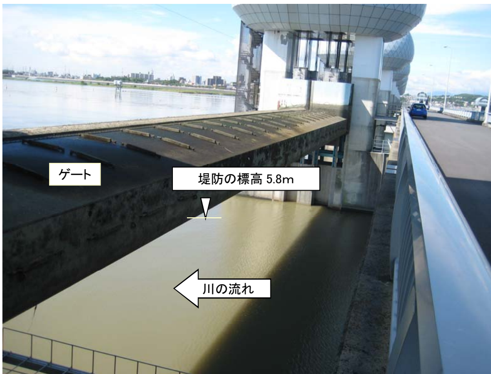
ゲート全開操作時の長良川河口堰（堤防より高い位置にゲートを引き上げ）