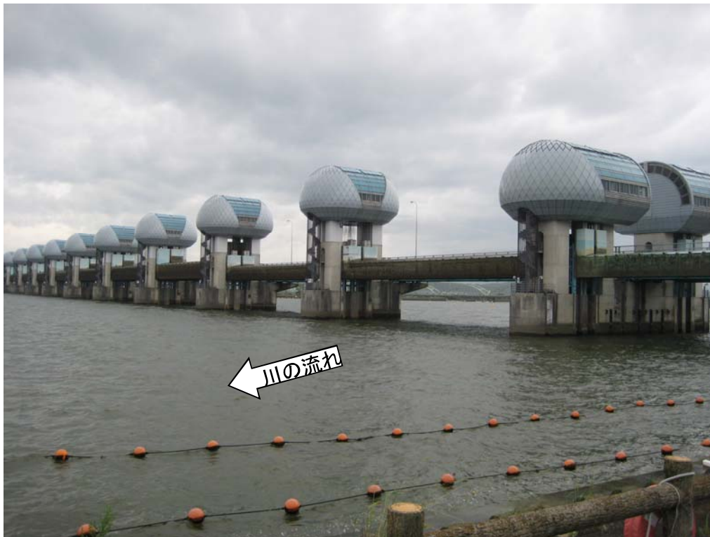
ゲート全開操作時の長良川河口堰（堰下流側）