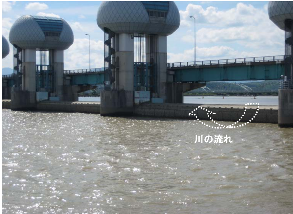
ゲート全開操作終了後の長良川河口堰（アンダーフロー操作に切り替え）