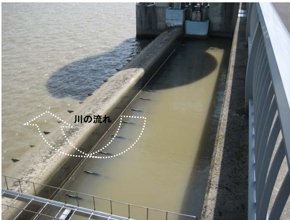
ゲート全開操作終了後の長良川河口堰（アンダーフロー操作に切り替え）