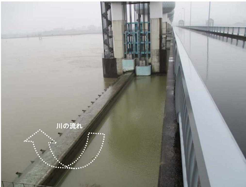
ゲート全開操作終了後の長良川河口堰（アンダーフロー操作に切り替え） 9月22日6時45分撮影