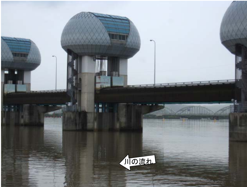
ゲート全開操作時の長良川河口堰（堰下流側）