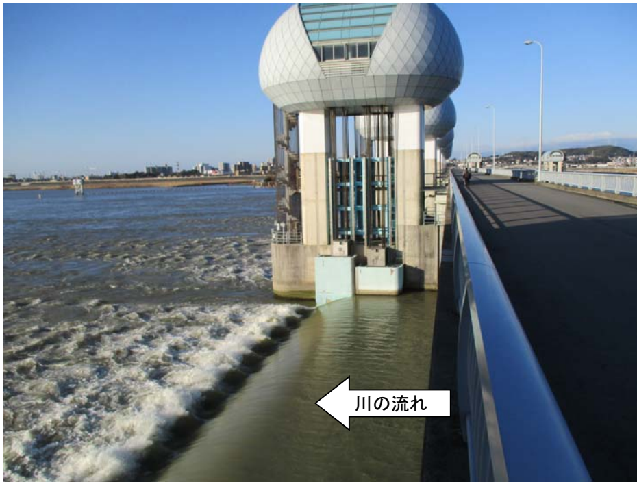
ゲート全開操作終了後の長良川河口堰