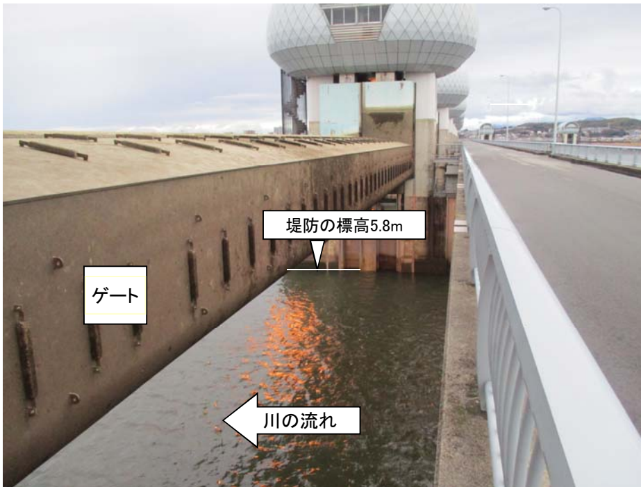
ゲート全開操作時の長良川河口堰(堤防より高い位置にゲートを引き上げ)