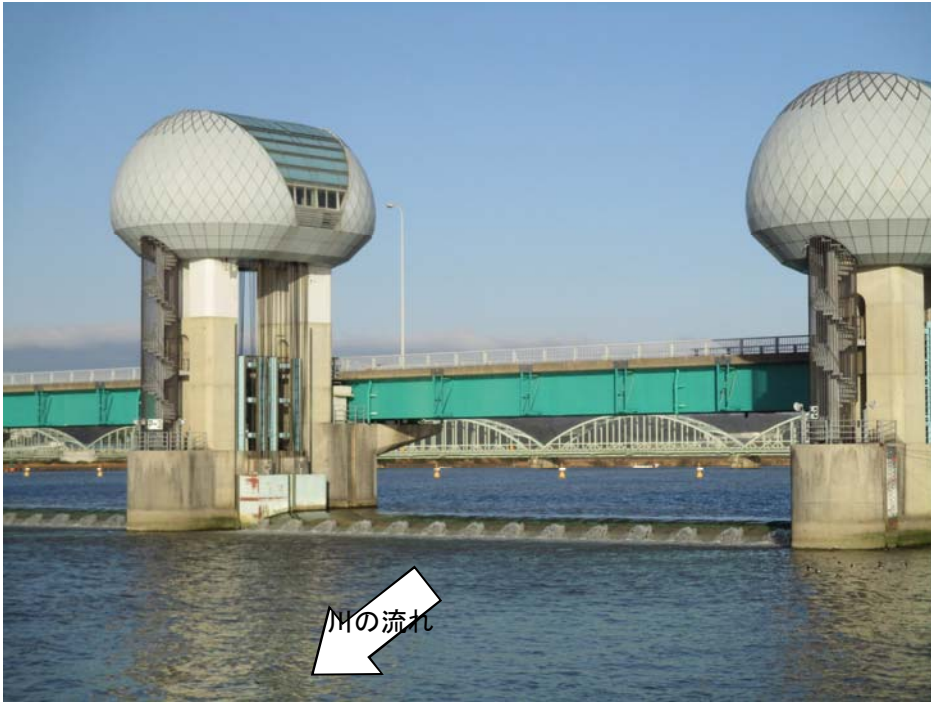
ゲート全開操作終了後の長良川河口堰