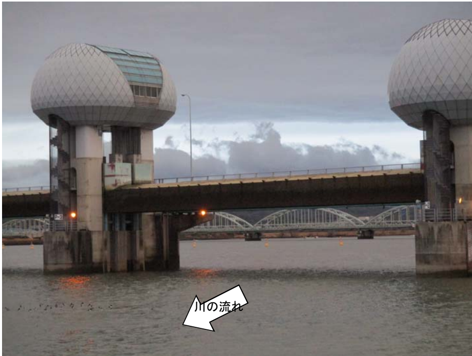
ゲート全開操作時の長良川河口堰(堰下流側)