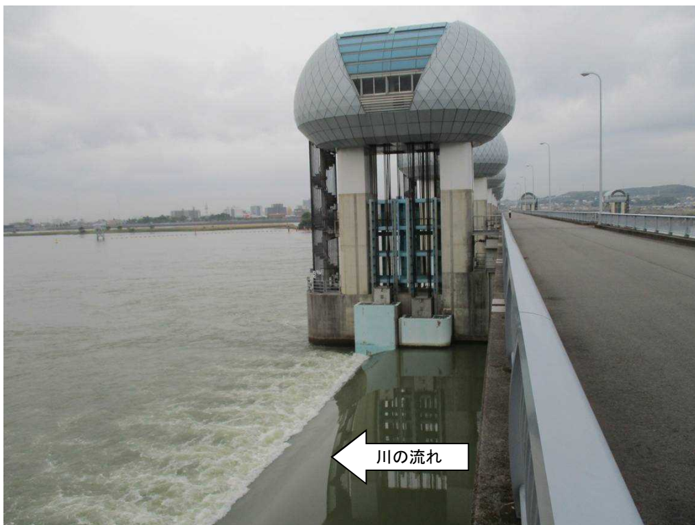
ゲート全開操作終了後の長良川河口堰