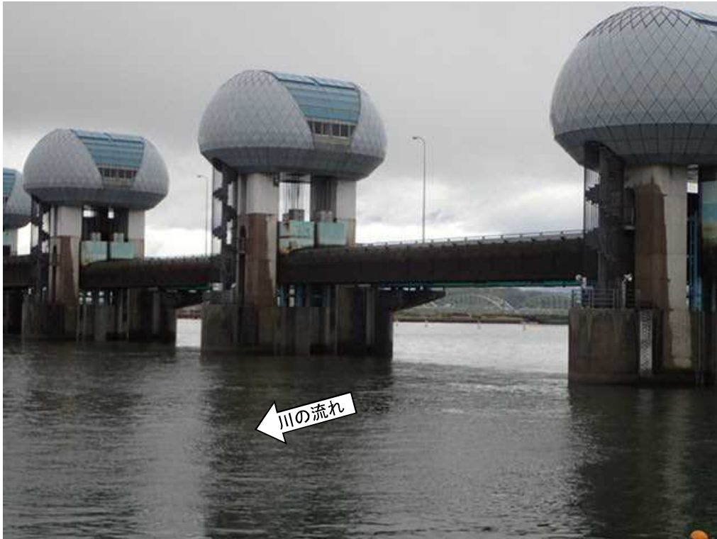
ゲート全開操作開始後の長良川河口堰(堰下流側)