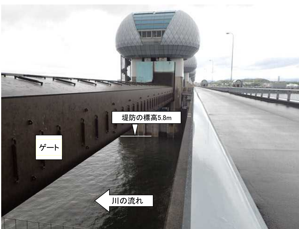
ゲート全開操作開始後の長良川河口堰(堤防より高い位置にゲートを引き上げ)