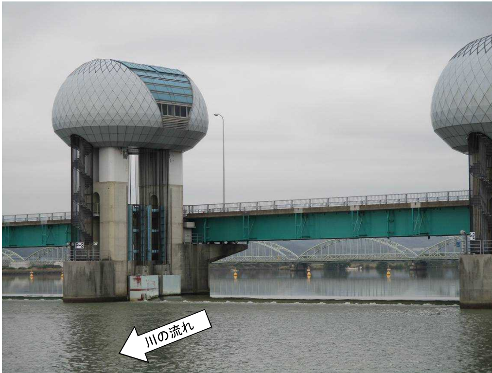
ゲート全開操作終了後の長良川河口堰