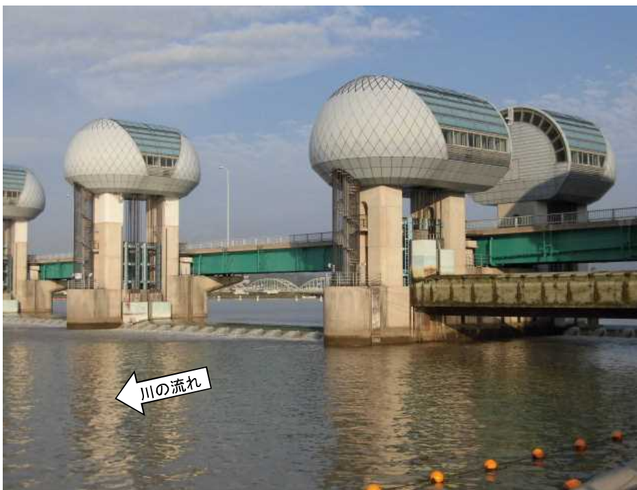
ゲート全開操作終了後の長良川河口堰（オーバーフロー操作に切り替え） 9月6日 7時10分撮影