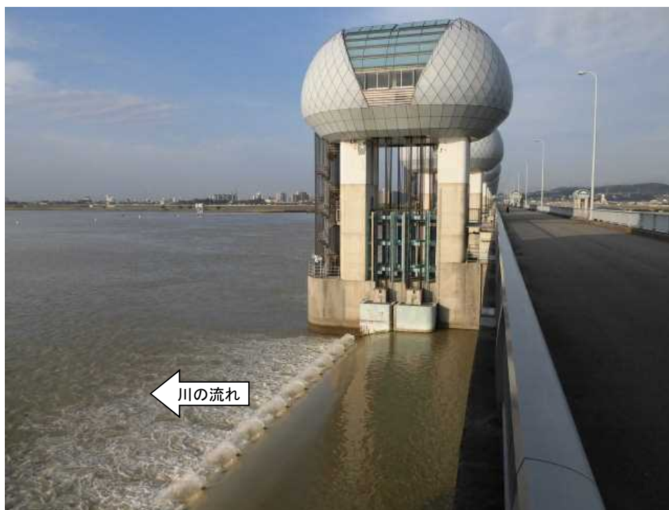
ゲート全開操作終了後の長良川河口堰（オーバーフロー操作に切り替え） 9月6日 7時10分撮影