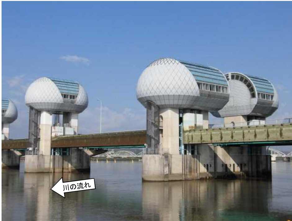
ゲート全開操作開始後の長良川河口堰（堰下流側）