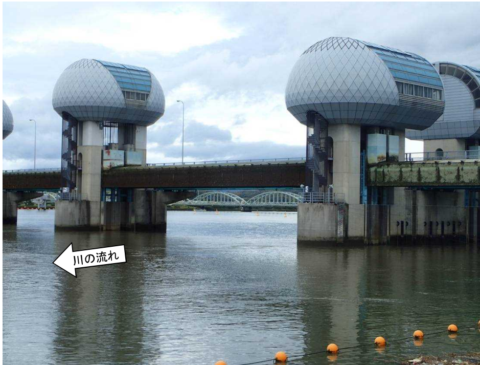
ゲート全開操作開始後の長良川河口堰（堰下流側）