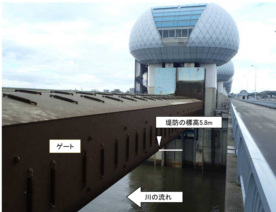
ゲート全開操作開始後の長良川河口堰（堤防より高い位置にゲートを引き上げ）