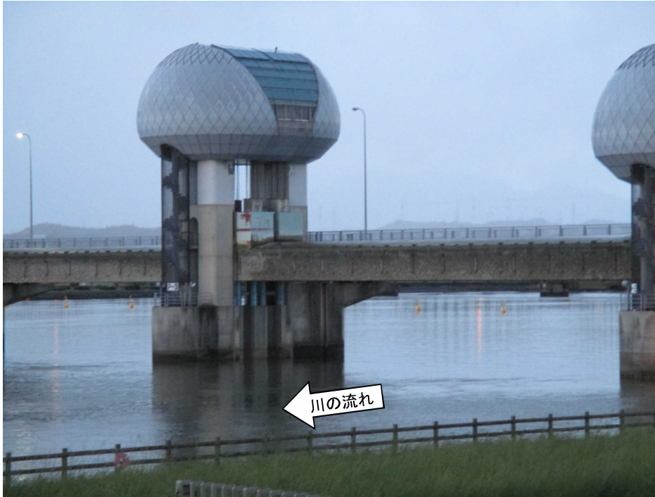
ゲート全開操作開始後の長良川河口堰（堰下流側）