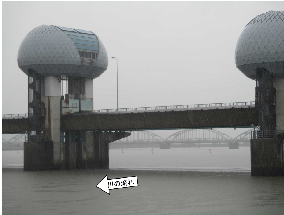
ゲート全開操作開始後の長良川河口堰（堰下流側）