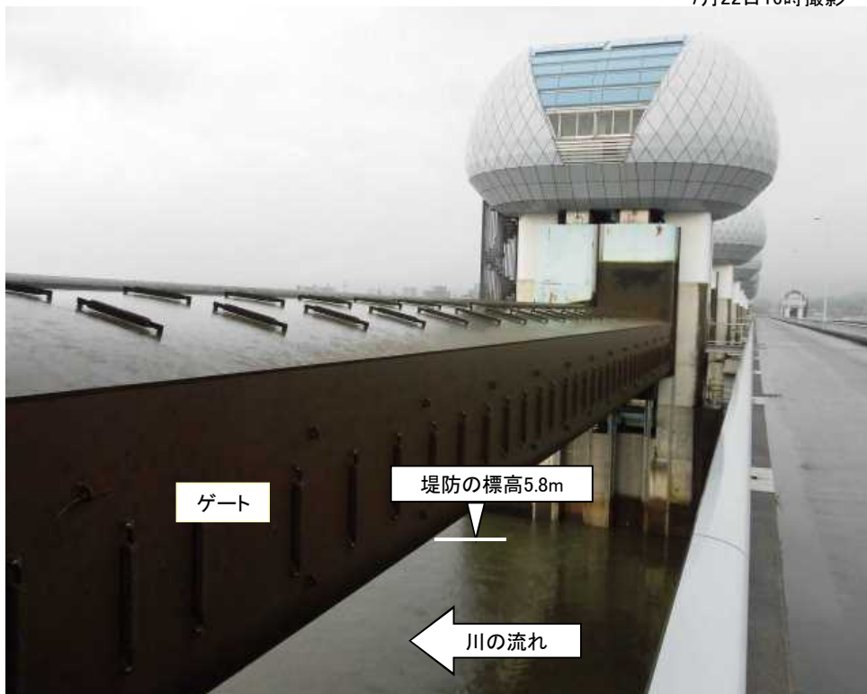
ゲート全開操作開始後の長良川河口堰（堤防より高い位置にゲートを引き上げ）