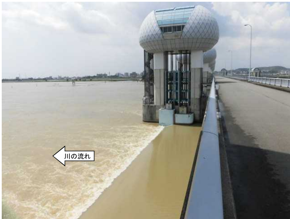
ゲート全開操作終了後の長良川河口堰（オーバーフロー操作に切り替え） 7月23日 11時撮影