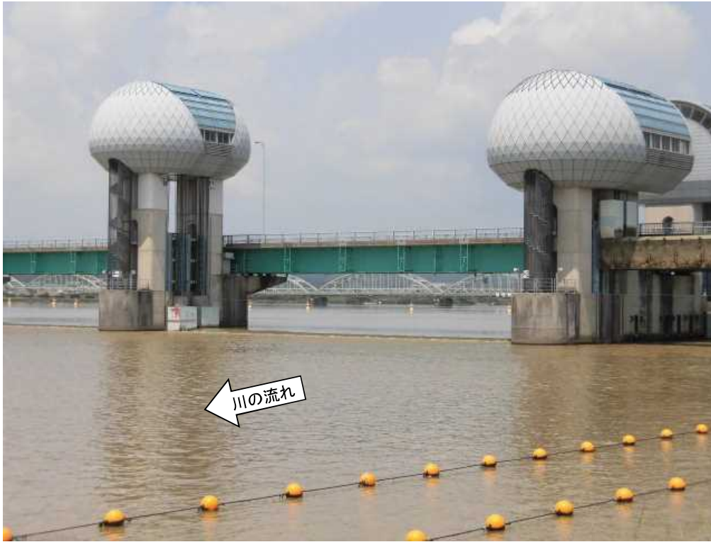
ゲート全開操作終了後の長良川河口堰（オーバーフロー操作に切り替え） 7月23日11時撮影