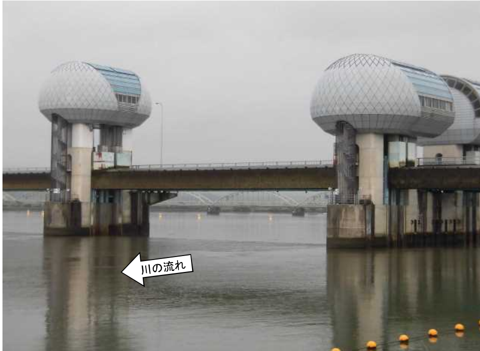
ゲート全開操作開始後の長良川河口堰（堰下流側）