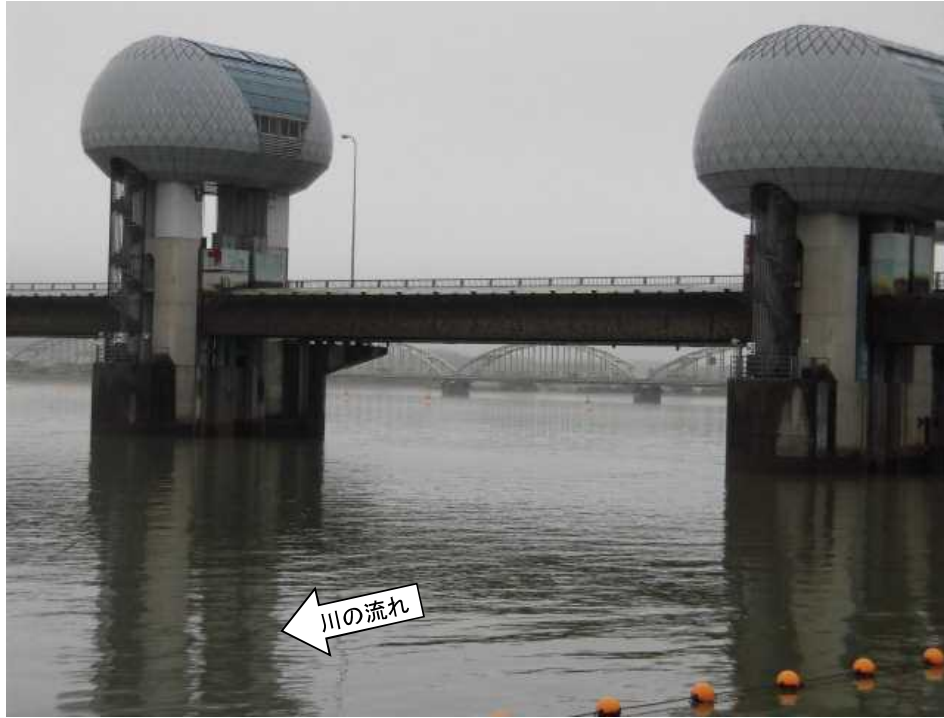
ゲート全開操作開始後の長良川河口堰（堰下流側）