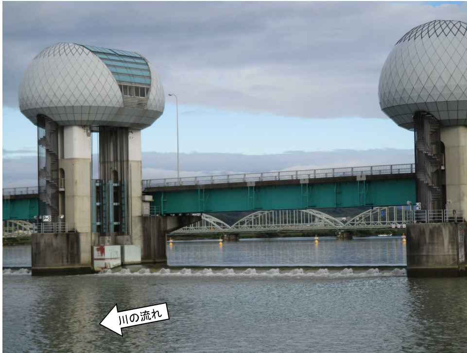
ゲート全開操作終了後の長良川河口堰（オーバーフロー操作に切り替え） 7月16日 6時撮影