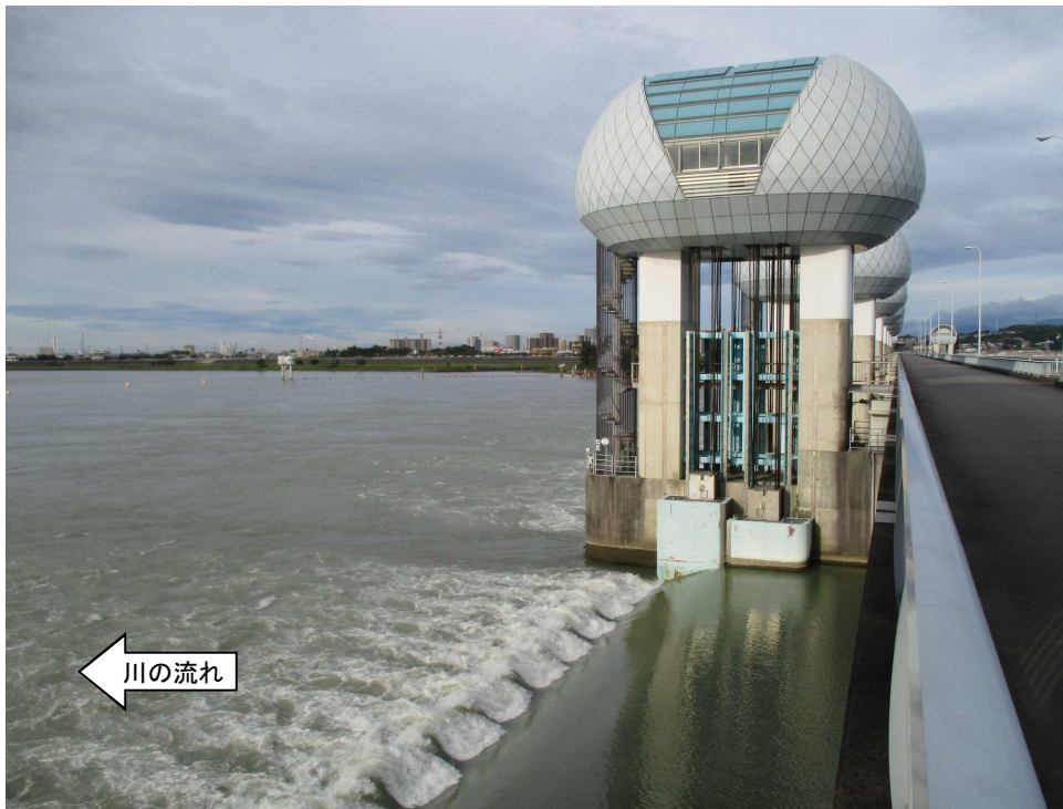
ゲート全開操作終了後の長良川河口堰（オーバーフロー操作に切り替え） 7月16日 6時撮影