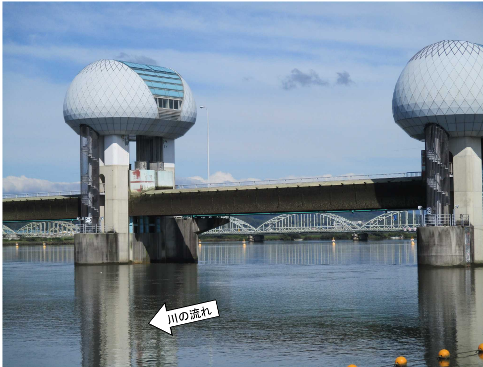
ゲート全開操作開始後の長良川河口堰（堰下流側）