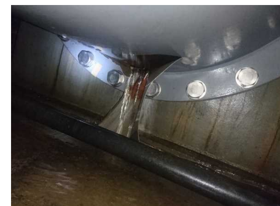
管路欠損状況 【吸込管 (φ900mm)】