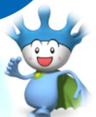
長良川河口堰 キャラクター あっくん